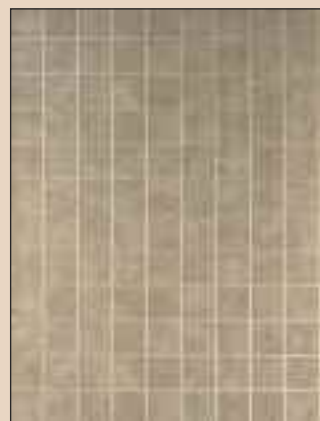
Taupe Stone Typ: 735