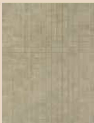
Sand Stone Typ: 736