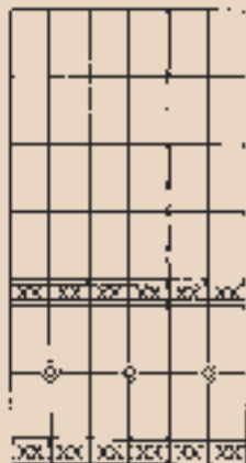
Schéma skladby (550+551)