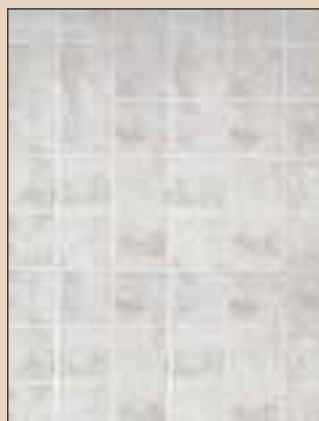
Milan Marble Typ: 700