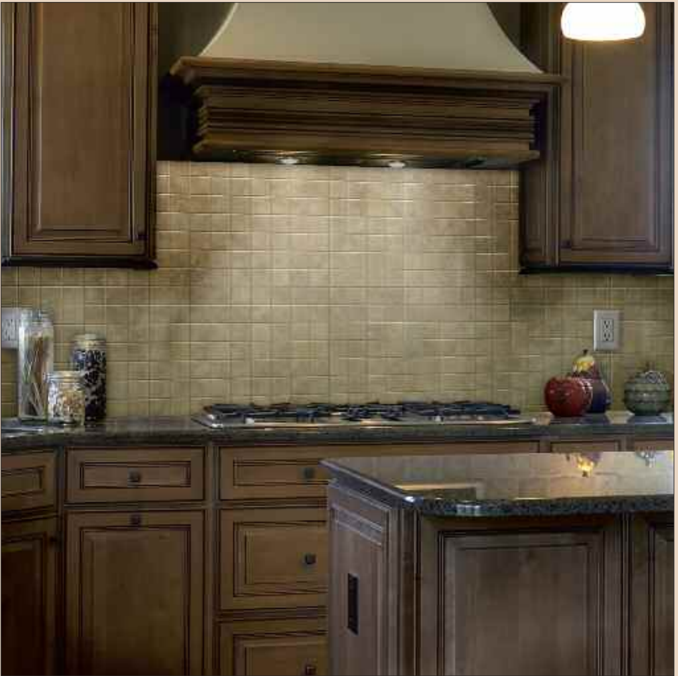
Panel Sand Stone