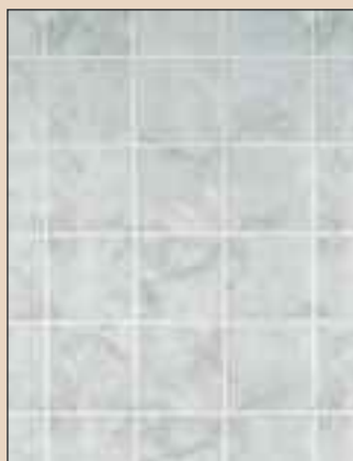
Graystone Typ: 704