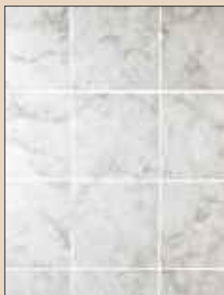
Roman Fawn Typ: 702