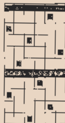
Schéma skladby (630+631)