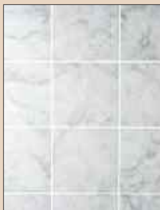
Silver Quartz Typ: 703