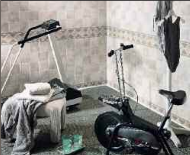
Panel Marble Mosaic