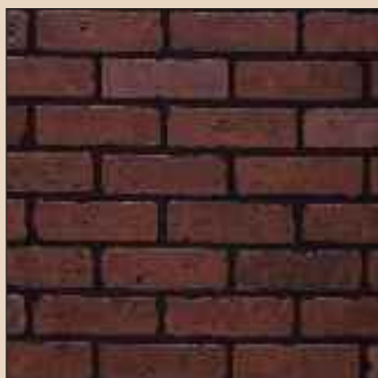
Gaslight II Typ: 288