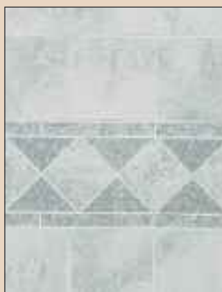
Pearl Mosaic Typ: 522