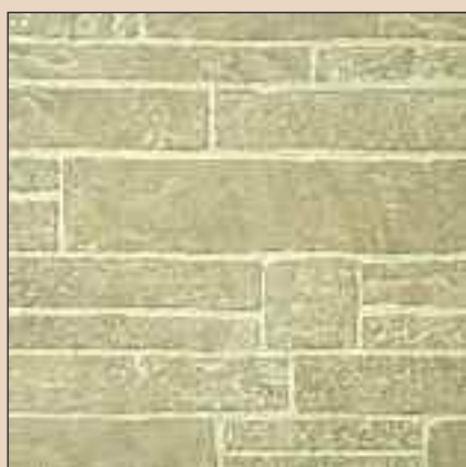
Beach Stone Typ: 169