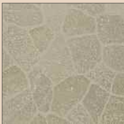
Castlerock Typ: 298