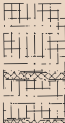
Schéma skladby (521+523)