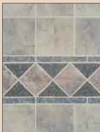
Pewter Rose Mosaic Typ: 523