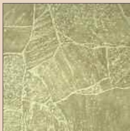
Capri Stone Typ: 166