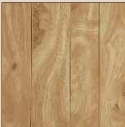
Honey Birch Typ: 119