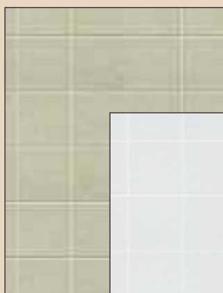
Toned Tan Typ: 626 Toned White Typ: 627