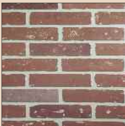
Carriage House Typ: 290