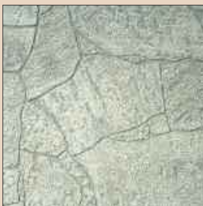
White Stone Typ: 167