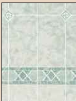
Dynasty Green Typ: 551