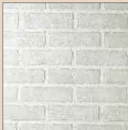
Brick Bianco Typ: 287