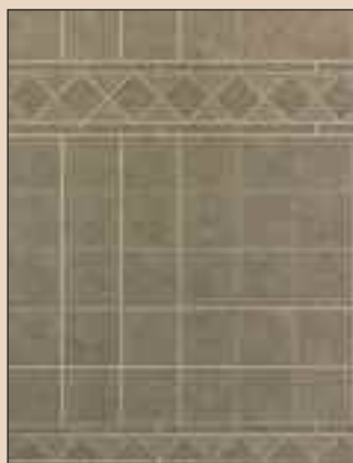
Florentine Mosaic Typ: 528