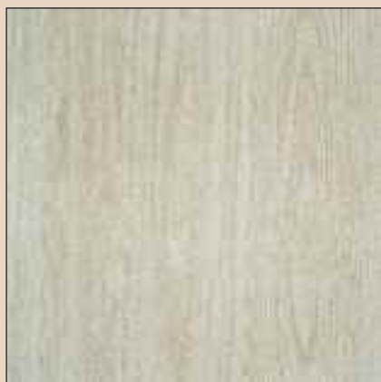
Westminster White Typ: 125