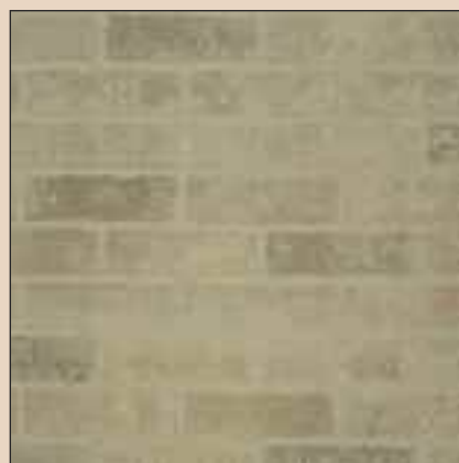
Brookline Typ: 297