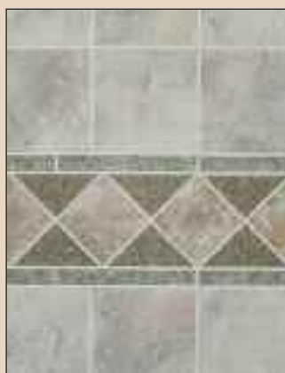
Marble Mosaic Typ: 521