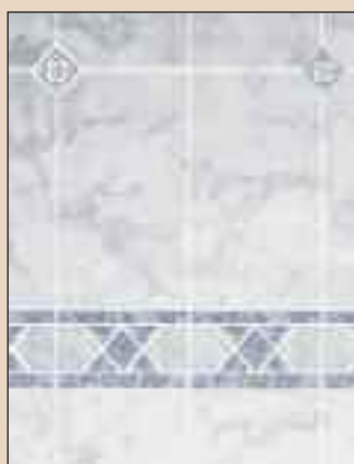
Empire Blue Typ: 550