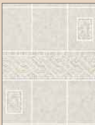
Alicante Typ: 630