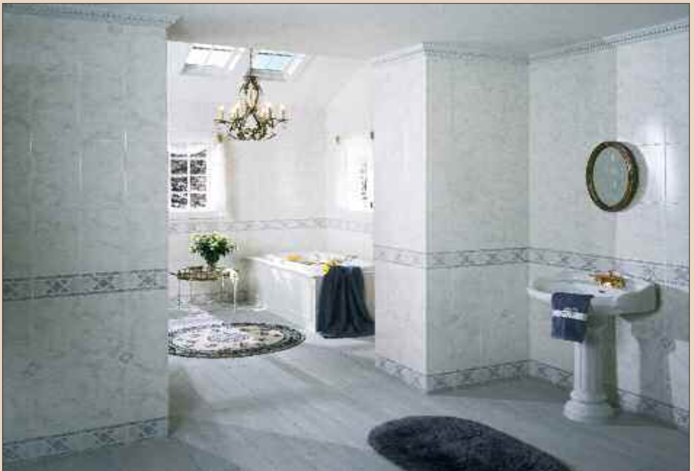
Panel Empire Blue