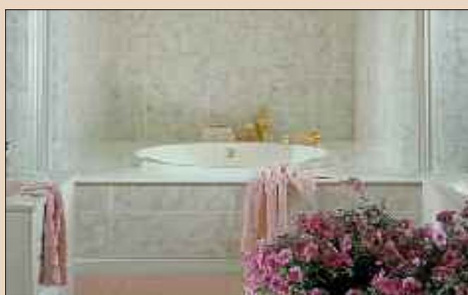
Panel Silver Quartz