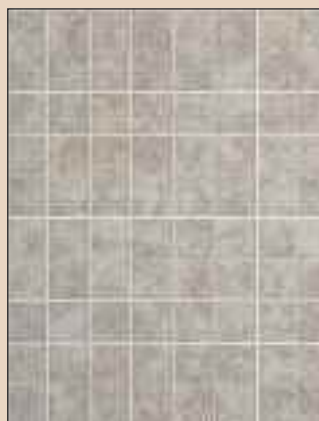
Jurassic Tan Typ: 730