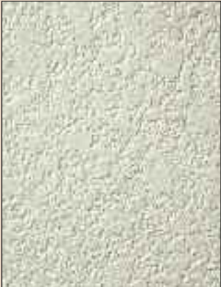
Hacienda Typ: 162